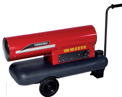
TA 22 / 30