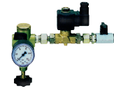
Aansluit- / reduceerset